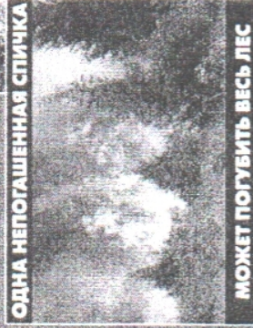
ОДНА НЕПОТАШЕННАЯ СПИЧКА